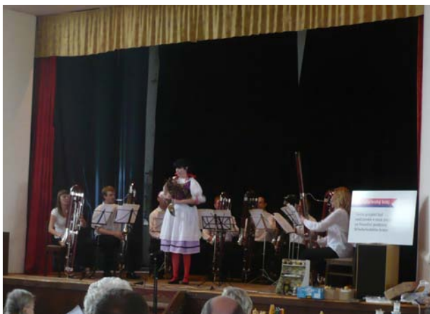
9 kontrafagotů a dudačka aneb nečekaná kompatibilita...