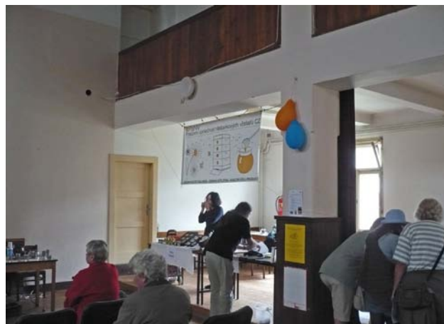
Koutek PSNV-CZ se právě začíná zařizovat...